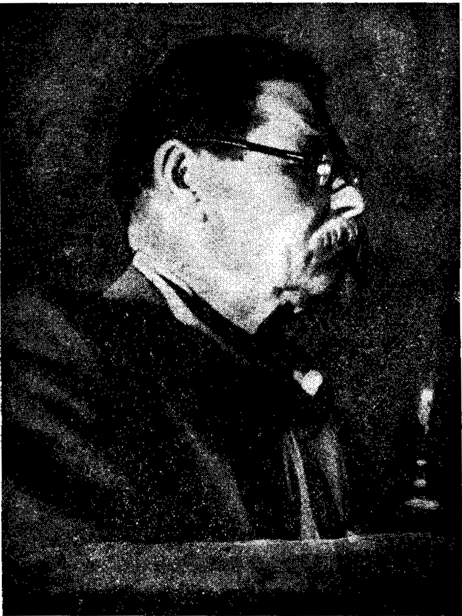
الکسی - ماک-جمویج - پشتکوف - گورکی